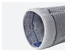
Silikonisierung am oberen Bandagenrand