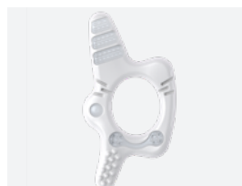
Pelotte mit Funktionszonen