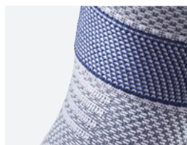
Dehnungszone im Unterschenkelbereich