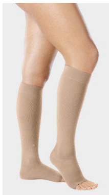
AD · Mandel Fußspitze offen