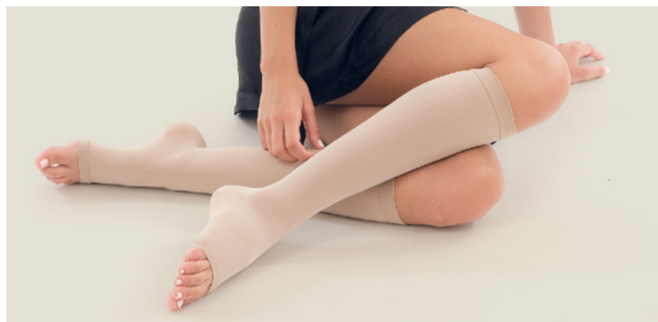
Kniestrumpf, offene Spitze in beige