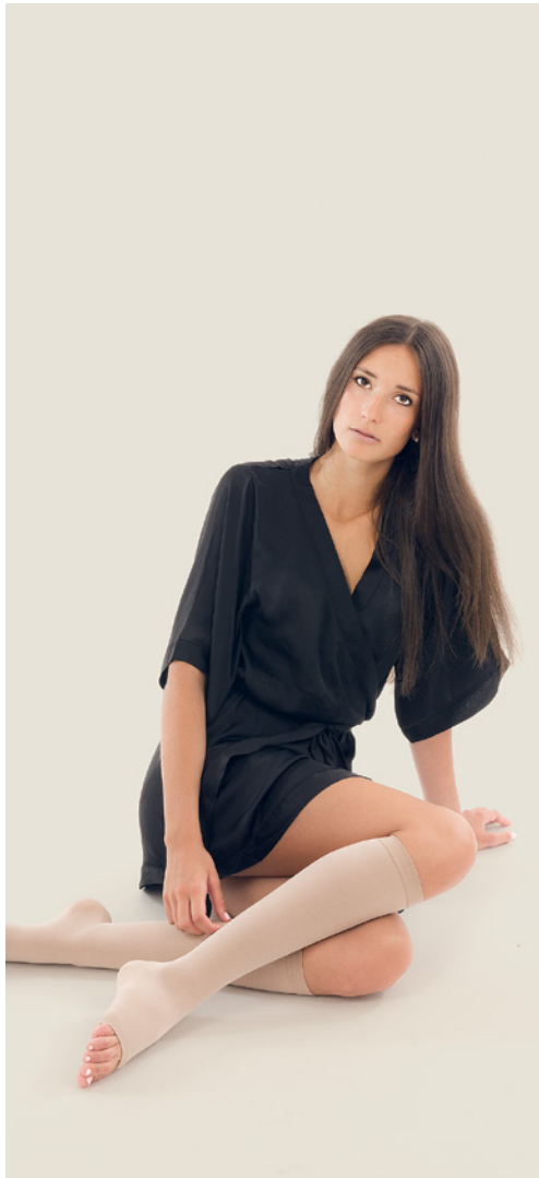
Kniestrumpf, offene Spitze