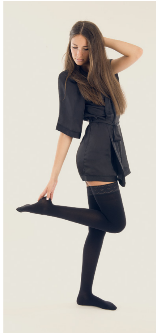
Schenkelstrumpf mit Spitzenhaftband